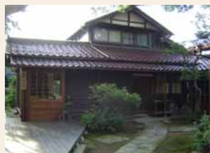
山の文化館・別館「聴山房」

山の文化館・別館「聴山房」もその一つで、深田久弥氏意思を生かした活動拠点としての活用だけでなく、より来客者の方々にくつろぎ・憩いでもらえる空間づくりを行うため、敷地内の住宅部分を改修し、飲食・グッズ販売をするお店としてオープンしています。