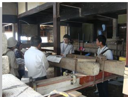
町家見学会の様子