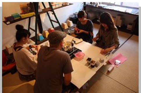
町家ワークショップの様子

【謝辞】「町家巡遊 2013」にご協力いただいた町家の方々、参加いただいた方々に感謝申し上げます。