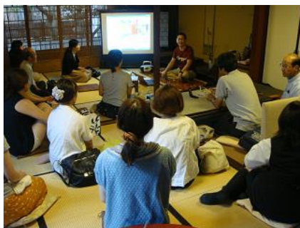
町家トークの様子