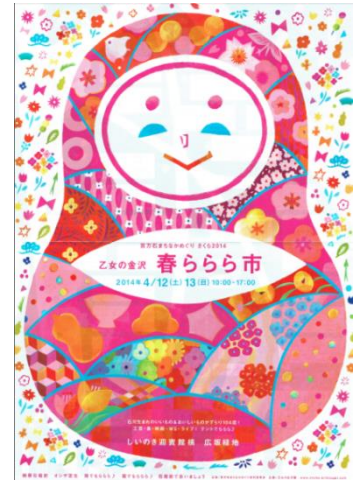
乙女の金沢 春らら市チラシ

今年は天候にも恵まれ、広場はお花見を兼ねた多くの人で賑わいました。町家猫パン1日100個限定販売は、お昼には完売！お子さんたちに人気があったようです。ありがとうございました。金沢市の「金澤町家再生活用事業」のリーフレットや「金澤町家巡遊ショップマップ」なども手に取っていただき、金澤町家についての各種情報提供ができたのではないかと思います。また、寺町台商興会が金沢市の助成を受けて作成した「寺町まっすぐ」新聞も人気がありました。