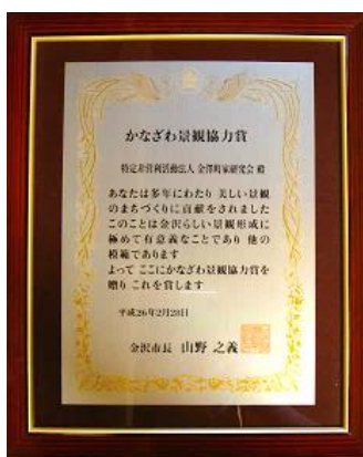
かなざわ景観協力賞表彰状

金澤町家研究会が、金沢市の「かなざわ景観協力賞」を受賞し、平成26年2月28日に金沢市役所において表彰式がありました。