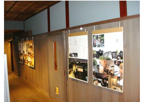
写真：パネル展示の様子