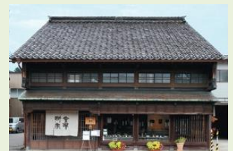
ギャラリー棟外観