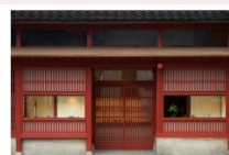
茶室系施設(「福島橋」リニューアル)4周年記念展示会 Event in Kanazawa 2022