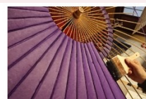
伝統工芸展示(和傘) Event in Kanazawa 2022