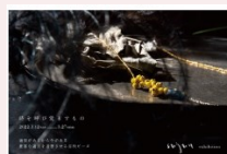
「時を呼び戻すもの」 Event in Kanazawa 2022