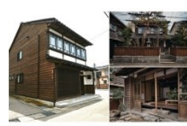
金澤町家館、金澤町家を学ぶ「金澤町家の活用事例と物件展示のよつ」 Event in Kanazawa 2022