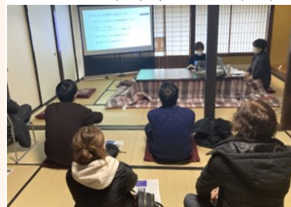
金澤町家情報館での参加の様子