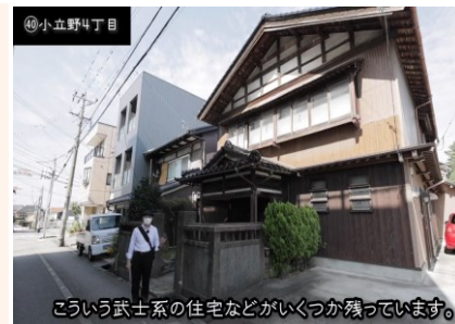
金澤町家探訪の様子 (スクリーンショット)