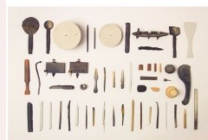
Come Back to The Clay 博覧(Chen Xunlang) 博覧 Event in Kanazawa 2022