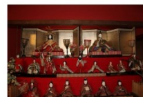
湖東江戸村の雛飾り Event in Kanazawa 2022